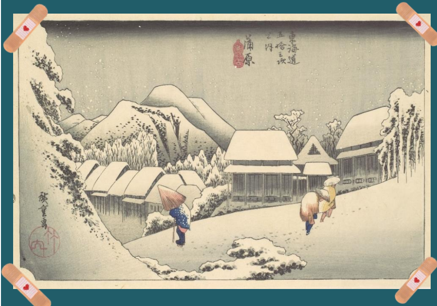
Утагава Хиросигэ «Вечерний снег в Канбаре»

«Вот север, тучи нагоняя, Дохнул, завыл – и вот сама Идёт волшебница зима <...> Блеснул мороз. И рады мы Проказам матушки зимы», –